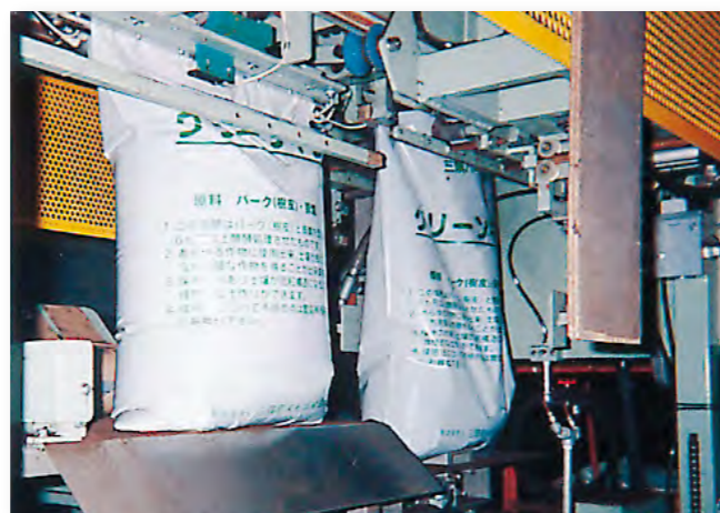
セミ重袋【肥料袋・米袋】

産業用・工業用など幅広い分野で利用されるポリエチレン製品です。小幅から最大12m幅のシートまでお客様のご要望に合わせてサイズ・仕様にて生産しております。